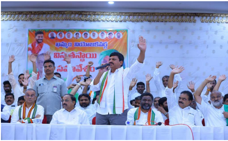
పాలేరు సమావేశంలో మాట్లాడుతున్న పొంగిలేటి